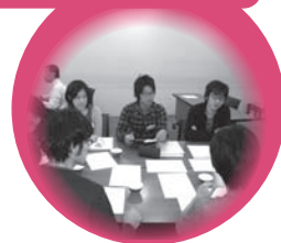
学生同士のディスカッション