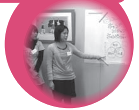
コミュニケーション・プレゼンテーションゼミ